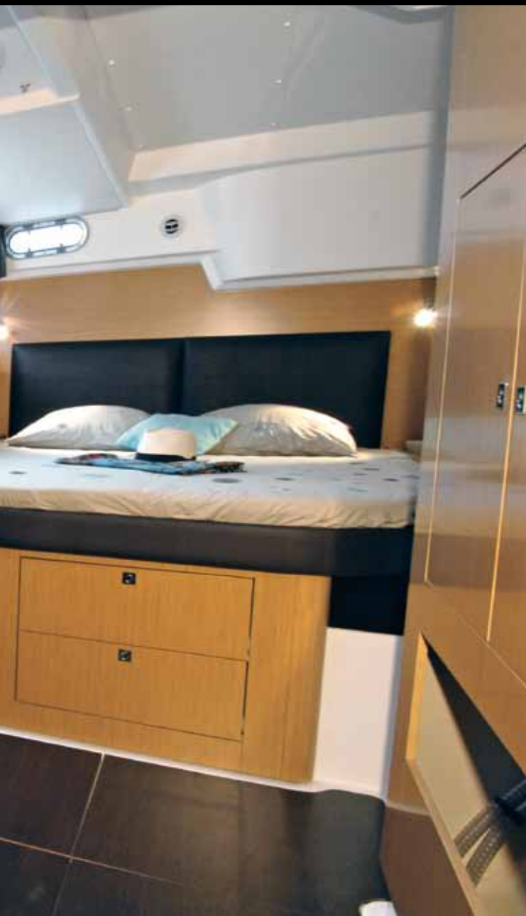
Versione Maestro: Una suite proprietario eccezionale